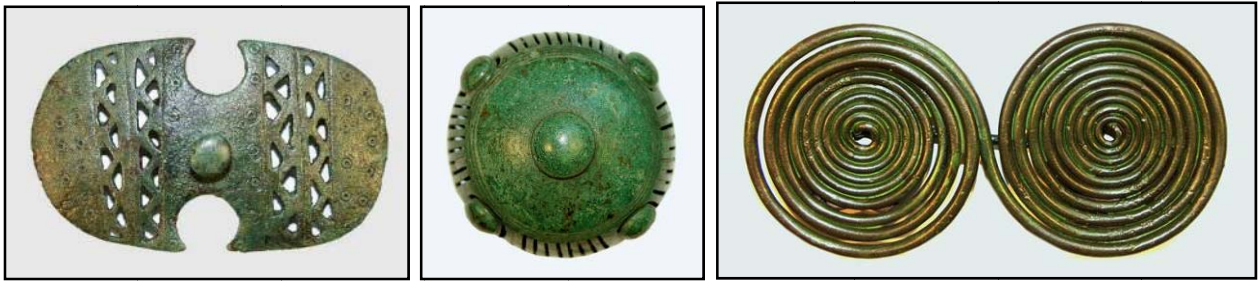
Сл. 8. Подемот на регионот во железното време се должи на рудните ресурси во околината. Бројни предмети од т.н. арсенал на македонско-пајонски бронзи со утилитарна и декоративна намена, изработувани од самороден бакар, користени се во текот на животот, за потоа да бидат приложувани во гробовите заедно со починатите. Токи, ремени, пафти, фибули, копчиња ја краселе облеката.