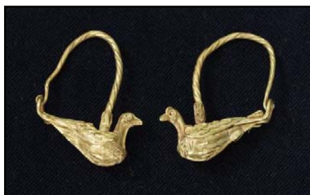
Сл. 22. Халкидичкото златарство кое уште од архајскиот период, (на кој му припаѓаат некрополите кај Синдос и Требеништа), доминира во тореутиката на Егејското крајбрежје, и натаму избирава накит со врвни квалитети. Техниката на филигран и гранулација, употребата на полудраги камења, доаѓа до израз на накитот откриван како гробна содржина на некрополите во Исар-Марвинци. Како доминантни се јавуваат обетките во форма на гулаб, лавовски протоми, Ерос, или негроидни глави како исклучителен моден бран во хеленистичкото време во Македонија.