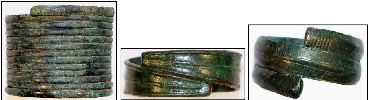
Сл. 9. Накит - белегзии и гердани кои припаѓале на починатите, изработени од самороден бакар