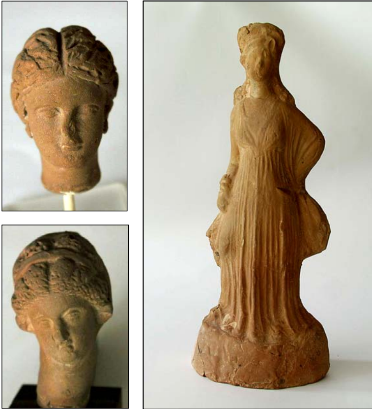
Сл. 21. Теракотите како гробни прилози, покажуваат широко распространета дејност на македонските короласти. Овој суптилен занает со вистински уметнички квалитети достигнал совршенство во прикажување на грациозни женски фигури во префинет стил. Нивниот стил носи одлики на своето време како одраз и замена на големата уметност на класичната и хеленистичката епоха.

Исто така, теракотите како чест гробен прилог во ова време, производи на локалните мајстори, покажуваат една широко распространета дејност на македонските короласти. Овој суптилен занает со нота на вистинска уметност, во Македонија достигнува совршенство во прикажување на грациозни фигури на жени и разни божества прикажани во префинет стил. Репертоарот на ликовите одразува локална актуелна мода во која се назира префинет вкус на консументите и на мајсторите кои ги правеле (Сл. 21).