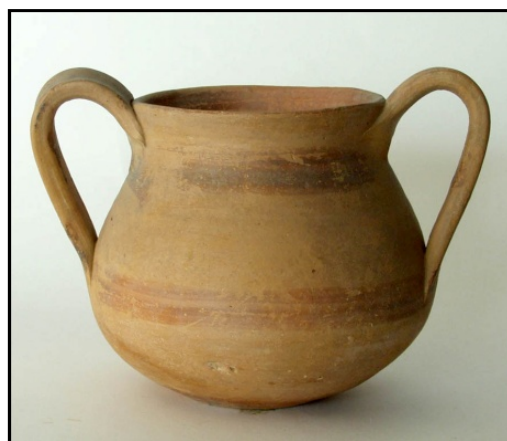
Сл. 7. Керамички садови работени на грнчарско колце, во разни форми со определена намена, редовно се поставувани во гробовите според ритуалниот обред од кој не се отстапувало.