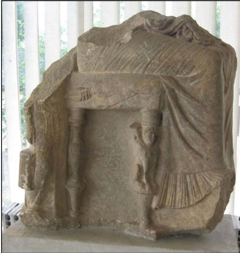
Сл. 14. Сцените на разделба прикажани на надгробните споменици со својата суптилноста и израз на воздржана тага претставуваат ненадмина-то совршенство во уметноста на класичната епоха. На нашиот споменик му недостасуваат ликовите со што ни е оневозможено да го согледаме изразот на претставените личности. Споменикот е работен под александриско влијание. Секако припаѓал на угледна дама од градот на Исарот. Најден е како сполија, вграден во објект од последната градежна фаза на Исарот.