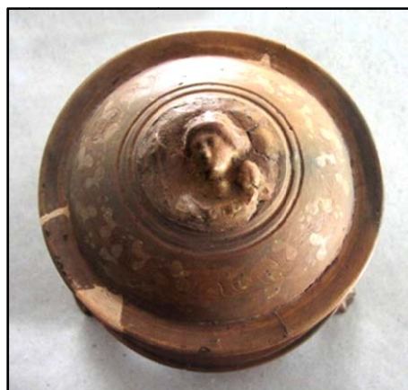
Сл. 20. Овие допадливи кутии за накит, кои му даваат специфичен белег на хеленистичкото време во Македонија, претставуваат одраз на цивилизиран дел од населението. Кај нас на Исарот откривани се во голем број како дарови во женските гробови.