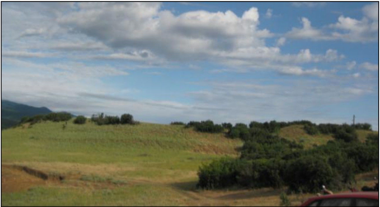
Сл. 1 . Поглед на Исар-Марвинци

Исарот е истурен пункт среде котлината каде дуваат силни ветришта. Акрополата што се наоѓа на највисоката кота од 131 м надморска височина морала да биде добро заштитена од атмосферските прилики на регионот. Најстарите траги од населбински слоеви се исклучително впечатливи. Куќите за живеење се лоцирани на позиции потпрени до карпите, при што, на поедини места карпите се засекувани до одредена длабочина за да се постигне стабилност и заштита на станбените и економските објекти. Ваква слика даваат остатоците од најстарата населба која се простира под акрополата, а особено на сртот кој се протега југоисточно од подоцнежниот римски каструм (Сл. 1, Сл. 3).