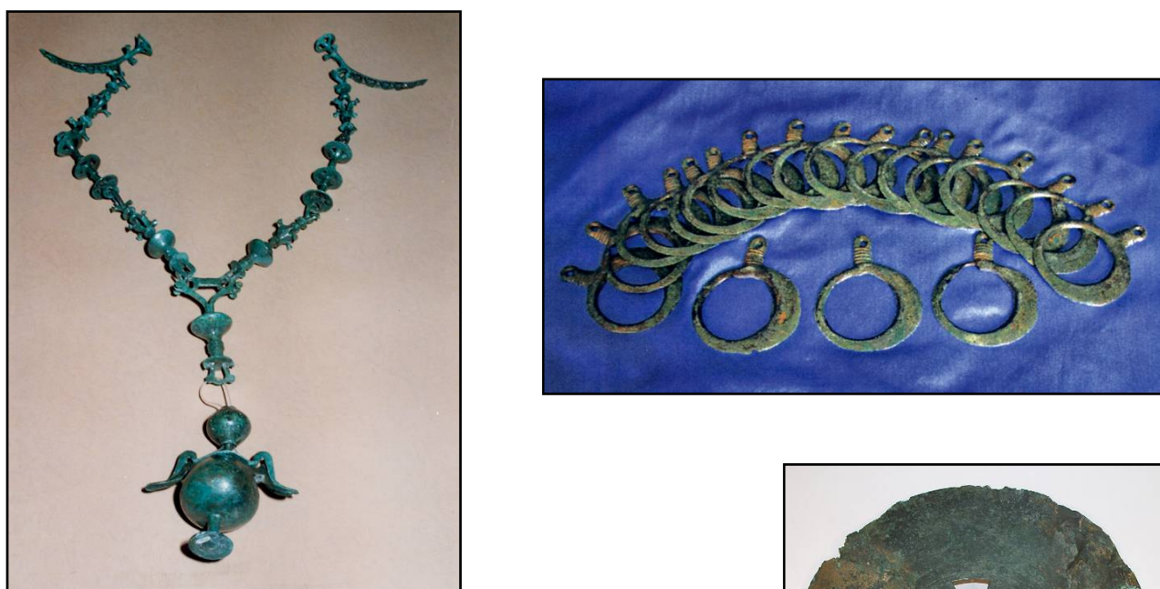
Сл. 11. Исклучително богат репертоар на предмети содржи гробот на т.н. свештеничка. Покрај накитот и предметите носени врз облеката, присутна е серија на култни предмети како реквизити кои биле во служба на нејзината професија и улогата што ја имала во окружувањето. Присуството на морфиум во афионовото чашче, чие дејство од дамнешни времиња било познато, секако треба да се поврзе со ова опојно сретство и неговата примена.