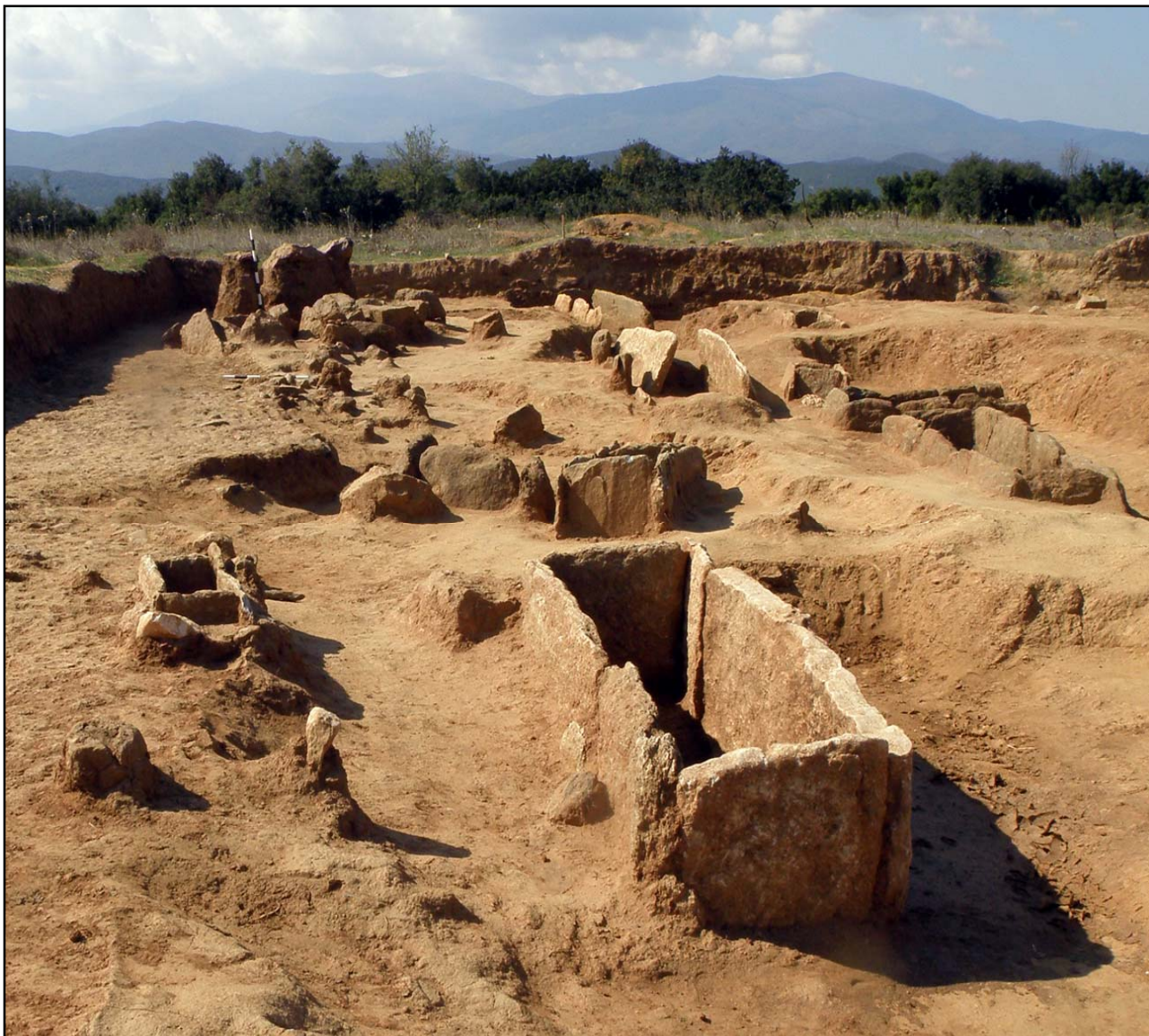
Сл. 6. Лисичин Дол, некропола со најголема концентрација на гробови од железно време на локалитетот. Тука е откриен гробот на познатата свештеничка.

Меѓутоа, најголема концентрација на гробови се наоѓа на местото познато како Лисичин Дол, оддалечено околу 600 м јужно од акрополата (Сл. 6). Всушност, нашите знаења за постарото железно време на Добер се базираат во прв ред врз откритијата на оваа некропола.