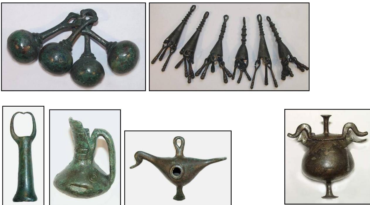
Сл. 10. Разновидни предмети чие значење сè уште не е доволно објаснето се предмети поврзани со верувањата на пајонската популација. Каква улога имале во изведувањето на култните дејствија никогаш нема да дознаеме. Во секој случај, во нив се преточени длабоките религиозни чувства и почитта кон умрените.