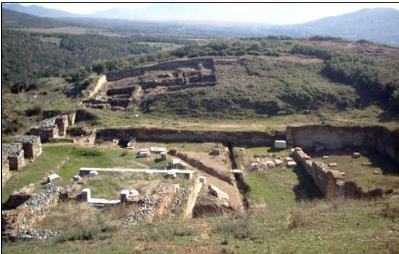
Сл. 1. Дел од откриените објекти на Исар-Марвинци

Населбата на Исарот немала недостиг на вода. Непосредната близина на реката Вардар секако била од примарно значење. Вода за пиење е користена од изворите кај Јанова Чешма уште од најрани времиња. Во раноримскиот период изграден е целосен систем на водовод. Водата е доведена од Врежи Дол, односно од локацијата кај Погана, од каде на места може да се следи системот на водоводот кој се совпаѓа повремено со современите патеки на теренот. Во секој случај, на највисоките тераси на Исарот, непосредно под акрополата, откриени се системите за вода кои покажуваат присуство на големи количини: изградени канали на водовод, градски терми со целосен систем за присуство на вода во објекти од ваков вид. За овој значаен момент од егзистенцијата на градот, ќе зборуваме во натамошното излагање.